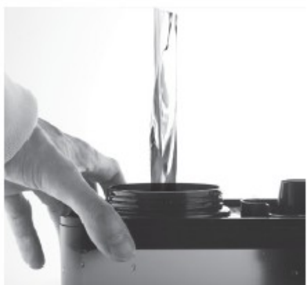
3. naplňte nádobu vodou