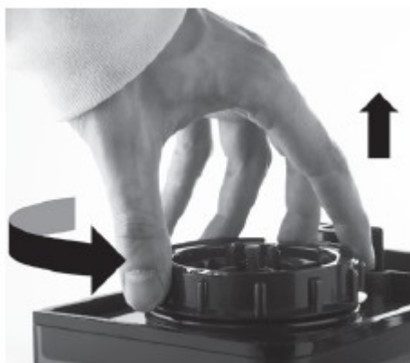
2. odšroubujte uzávěr