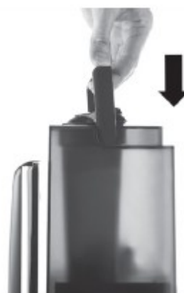
4. uzavřete nádobu uzávěrem a vložte zpět na původní místo