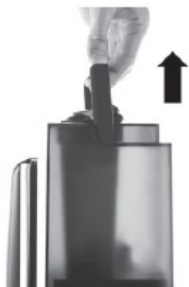
1. vyjměte nádobu na vodu